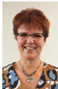
Lian Steijn Management Assistente